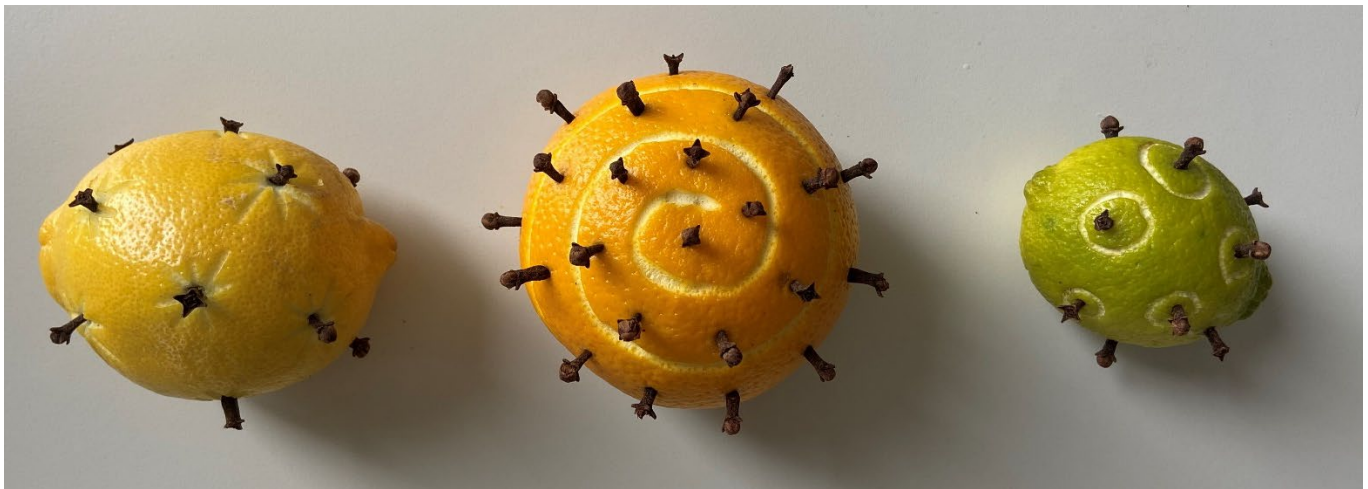
Abbildung 1: Verzierte Zitrusfrüchte (Forscherstation)

Wie wird aus einer Orange, einer Zitrone oder einer Limette eine duftende Dekoration? Kinder können hier ausprobieren , mit welchen Formen sie die Zitrusfrüchte verzieren können, und ihrer Kreativität freien Lauf lassen. Sie erproben ihre Sinne, um Unterschiede in Textur, Geruch und Farben zu erkennen. Durch Beobachten entdecken sie, wie sich die Früchte über einen Zeitraum verändern. So entsteht eine Dekoration für die Sinne in Orange, Grün und Gelb.