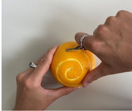
Abbildung 3: Orange und Linolschnitt-Werkzeug (Forscherstation)