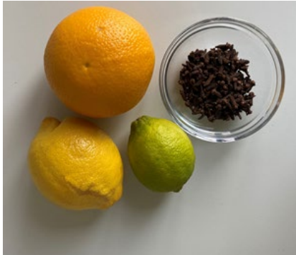
Abbildung 2: Zitrusfrüchte und Nelken (Forscherstation)