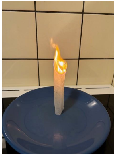
Abbildung 2: Am oberen Rand anzünden.