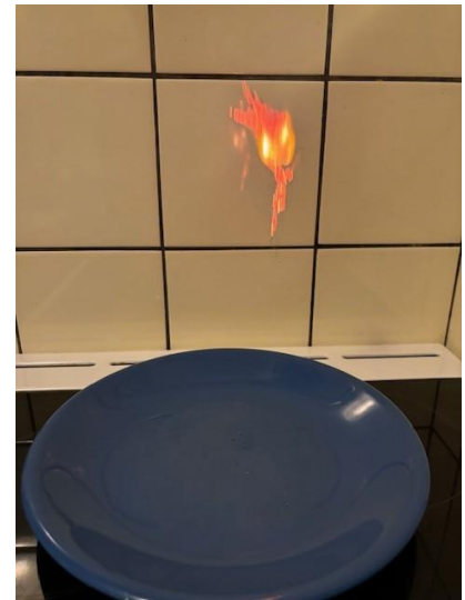
Abbildung 3: Sobald der Teebeutel leicht genug ist, fliegt der Rest durch die aufsteigende warme Luft nach oben.