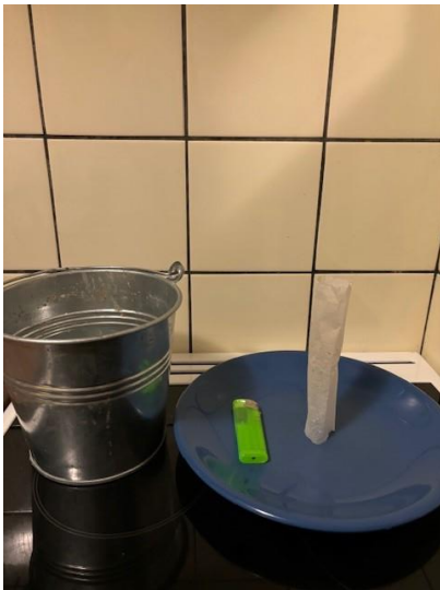
Abbildung 1: Den auseinandergefalteten Teebeutel auf einen Teller stellen.