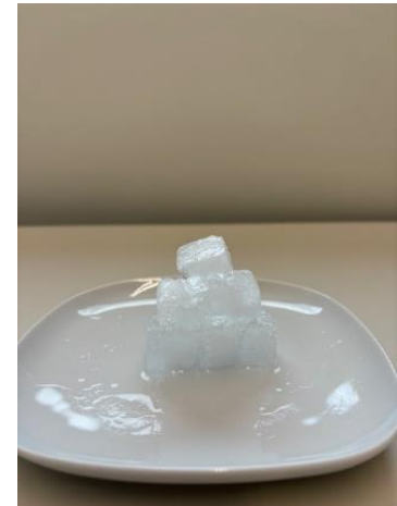
Abbildung 3: Eine Pyramide.