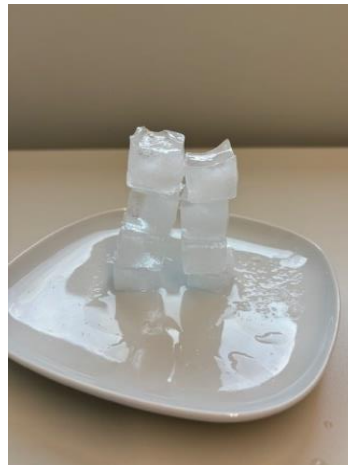
Abbildung 2: Zwei größere Türme.